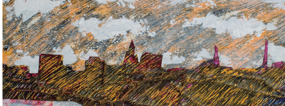
Un sueño indefinido 10 x 70 cms. Técnica mixta sobre papel.

Es pertinente preguntarse si es relevante tener un arte que podamos calificar de nuestro, o si se trata de entender que nuestra producción cultural es parte de un gran mosaico de expresividades universales que reflejan las singularidades propias de cada región. También son ciertas las palabras de José Martí: “De una patria, como de una madre, nacen los hombres”; y el lugar donde nacemos —y quién ha de ser nuestra madre—, no es algo que se elija, esa relación simplemente se da y es determinante para nuestro desarrollo afectivo y psicológico. Existe un concepto derivado del Romanticismo alemán, Kulturnation , que nos habla del “espíritu” de un pueblo determinado; por estos pagos, la construcción de nuestra distintividad siempre me interesó por la génesis de nuestro país como cuña entre dos frustradas potencias, por la determinante influencia de las corrientes migratorias, por ser un país sin estridencias que esconde la mugre bajo la alfombra. También me considero hijo de la cultura montevideana, de sus olores, de su música, de sus calles con recuerdos, de su silueta melancólica, sacudida por las sudestadas, veladuras de un sueño indefinido.