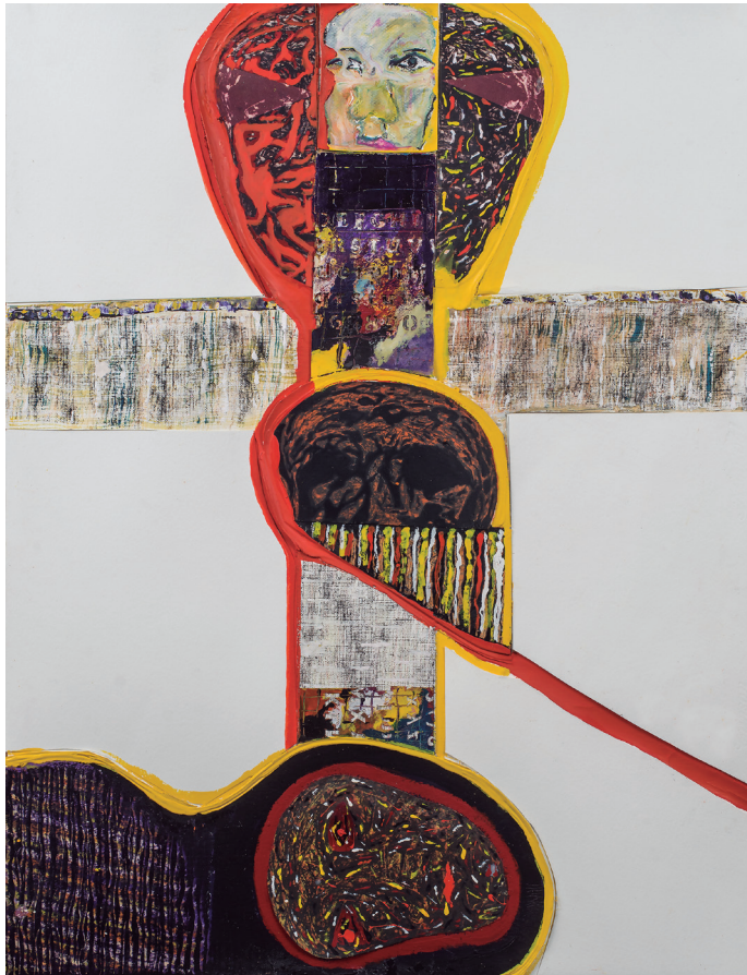
Más que el amor nos une el espanto 70 x 50 cms. Técnica mixta, grabado y tintas chinas de color (2018).