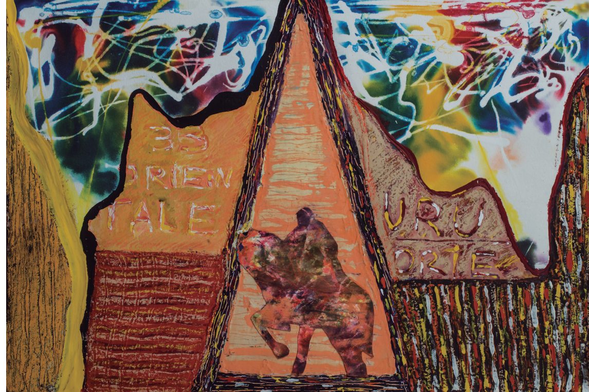
Un oriental, dos orientales, 33 orientales 20 x 45 cms. Técnica mixta sobre papel (2018).