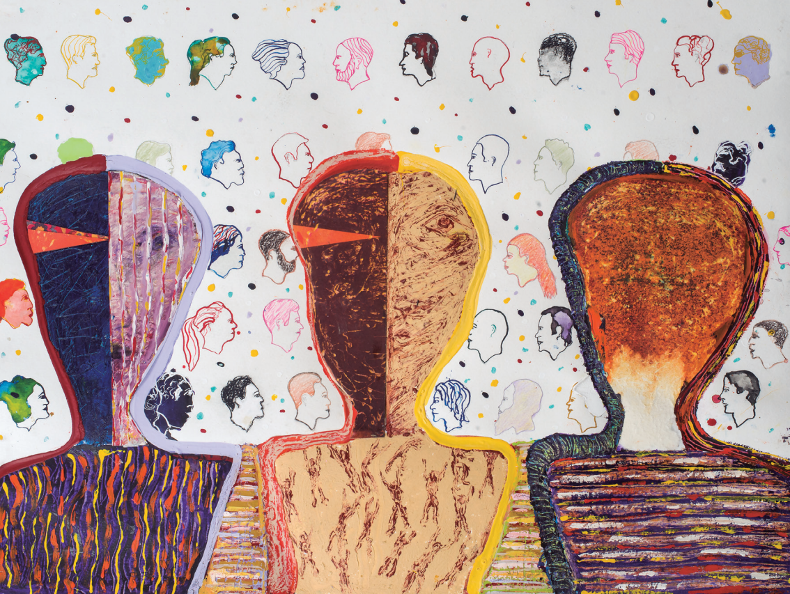
Emigrantes. 45x 70 cms. Técnica mixta, grabado y tintas chinas de color sobre papel (2018).

Mi generación se quemó las pestañas estudiando las culturas mediterráneas, pero después en el verano nos bañábamos en la playa Ramírez comiendo pan con grasa y tomando mate. ¿No habrá que excavar en la arena de la playa Ramírez? ¿No habrá algo allí?