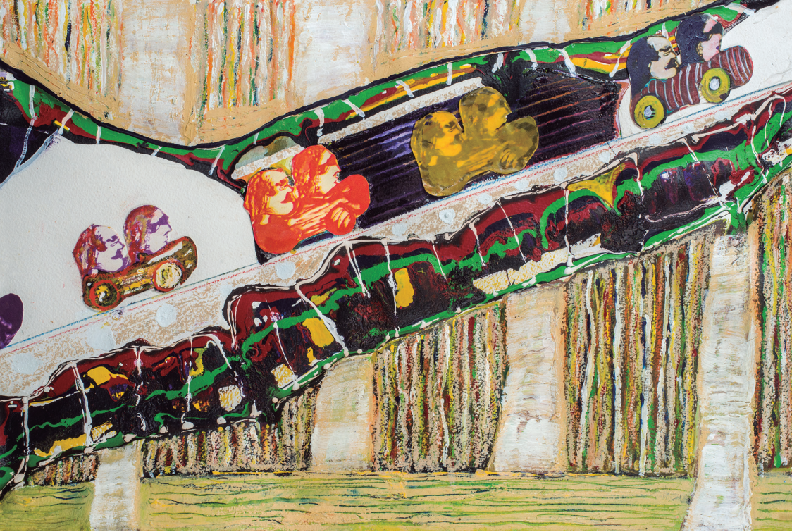
No hay apuro. 28 x 45 cms. Técnica mixta, grabado y tintas chinas de color (2018).

Montevideo es un lugar muy lejos, donde no puedo mentir y alguien siempre me está esperando.